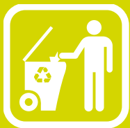
PRIMARNA SELEKCIJA OTPADA