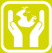
ZAŠTITA ŽIVOTNE SREDINE