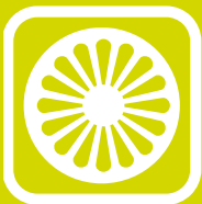
PROMOCIJA ROMSKE KULTURE