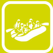
RAFTING / ADRENALINSKI URIZAM